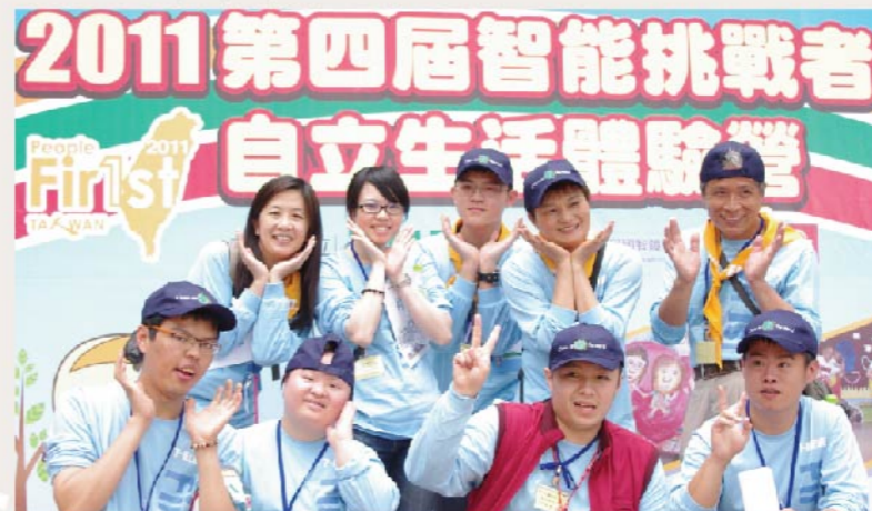
「智能挑战者の自立学習体験」 Independent Living Workshop for the Intellectually Challenged 統一超商のボランティアは心身障害者に自立生活のスキルアップにつながるサポートを行っております。7-ELEVEN volunteers help those with disabilities learn the basic skills to live independently.