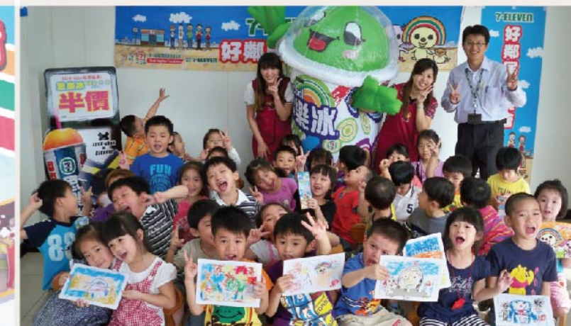
7-ELEVEN 好隣居同楽会 7-ELEVEN Good Neighbor Funfest 7-ELEVEN 松柏店にてドラえもんぬりイベントを開催し、子供たちが楽しい時間を過ごしております。Kids enjoying themselves at Doraemon coloring contest organized by 7-ELEVEN Songbo store.