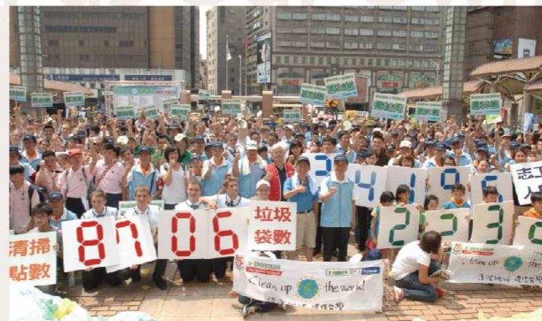
Clean Up the World 地球を綺麗に、台湾を守ろう Clean Up the World 10数年に渡り、清掃活動の推進に約3000万円の資金を投入し、参加者数は累計30万人を超えました。Investing more than 30 million NT into promoting clean up campaigns in the past 10+ years, attracting more than 300,000 participants.

To strengthen our role as an active member of local communities, 7-ELEVEN established "PCSC Good Neighbor Cultural and Educational Foundation" in 1999. Harnessing the power and resources of all of our stores, the foundation has engaged in activities that improve the environment and life qualities in different communities. For example, in response to the risks of global warming, 7-ELEVEN has initiated an energy-saving initiative that encourages every store to use energy more efficiently. 7-ELEVEN is also the leader in exercising recycling in the retail convenient store industry. All of the above initiatives have propelled many Taiwanese citizens to join the league of conserving resources and loving the earth. In 2010, PCSC became the first retailer in Taiwan that has a special CSR committee in our internal management structure, showing our determination to integrate CSR into our management and operation strategies. With the establishment of a CSR vision and a clear direction for our future development, 7-ELEVEN wishes to expand our influence step by step and contribute to the growth and advancement of our society.