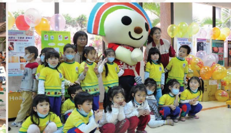
7-ELEVEN 好隣居同楽会 7-ELEVEN Good Neighbor Funfest 7-ELEVEN 高医一店にてお子様に大人気のOPENちゃんの手洗いの重要性を伝えております。7-ELEVEN Kaohsiung Medical University (1) store invites Open Chan, a kids' favorite, to promote the importance of hand washing.