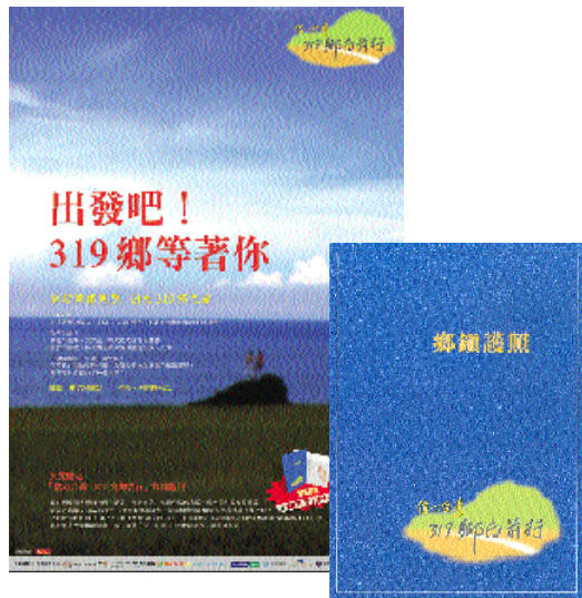
319鄉向前行四本專刊，個別介紹台灣北、中、南、東四區鄉鎮，邀您尋訪台灣之美

贊助由天下雜誌發起為期1年的「319鄉向前行」活動，號召台灣民眾在產業外移的環境變動下，走遍自己成長的土地，發現故鄉的可愛。民眾持天下提供的鄉鎮護照在全國探訪各鄉鎮風采時，可至7-ELEVEN門市內蓋上該鄉鎮專屬之紀念戳章，整體活動受到熱烈的回響。7-ELEVEN綿密的門市與親切的服務，讓愛鄉者更方便的收藏台灣行腳的美好記憶。