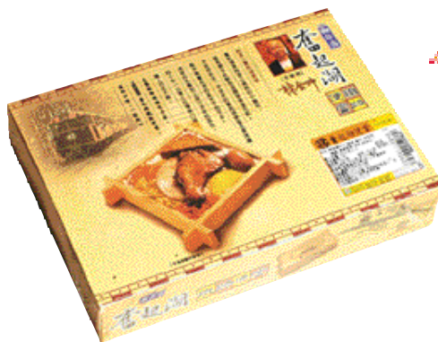
結合「名店、名物、名山、名水」的概念，推出「鐵路便當系列」，並首推奮起湖便當，不僅再創7-ELEVEN御便當銷售另一高峰，也成功引起話題，並促進奮起湖當地觀光產業復甦。