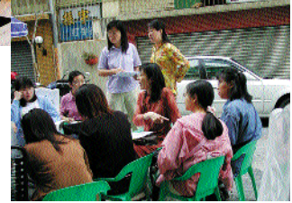
鄰里居民熱烈支持社區營造活動 一步步建構出優質的巷道文化