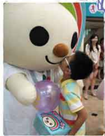
OPEN 小將贈禮物盒為心弟弟加油打氣，讓他超級開心忍不住獻吻

剛上小學的自閉童「心弟弟」，終於一圓心願，和偶像 OPEN 小將近距離互動遊戲和愛的抱抱，這也是雲林天主教若瑟醫院與好鄰居基金會合作舉辦的「OPEN! Cares 健康打氣站」全國巡迴關懷活動第八站的一段小插曲。當心弟弟第一眼看到 OPEN 小將時，興奮之情全部寫在臉上，又笑又跳的他忍不住上前與 OPEN 小將玩起「愛的抱抱」！OPEN 小將也特別為心弟弟加油打氣。心弟弟的爸爸分享 OPEN 小將是心弟弟封閉心靈的重要對外溝通管道，也是帶領心弟弟漸漸走出內心世界、接受外界刺激的媒介。這一路看著心弟弟表達能力的進步、學會用繪畫表達內心想法，一張張以 OPEN 小將為主角的圖畫作品，還曾為他取得全國兒童繪畫比賽小學低年級組第一名的殊榮，心爸爸為孩子感到驕傲，也希望他們的故事能夠鼓舞現場所有的家長與孩子。