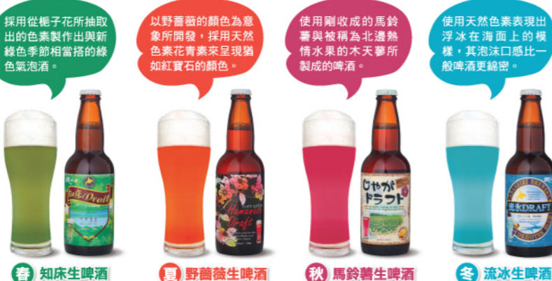
春 知床生啤酒 夏 野薔薇生啤酒 秋 馬鈴薯生啤酒 冬 流冰生啤酒