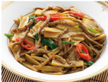
辣炒筍片肉絲 2-3人份