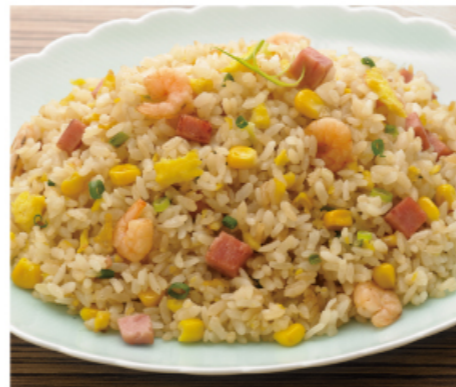
蝦仁火腿蛋炒飯 2-3人份