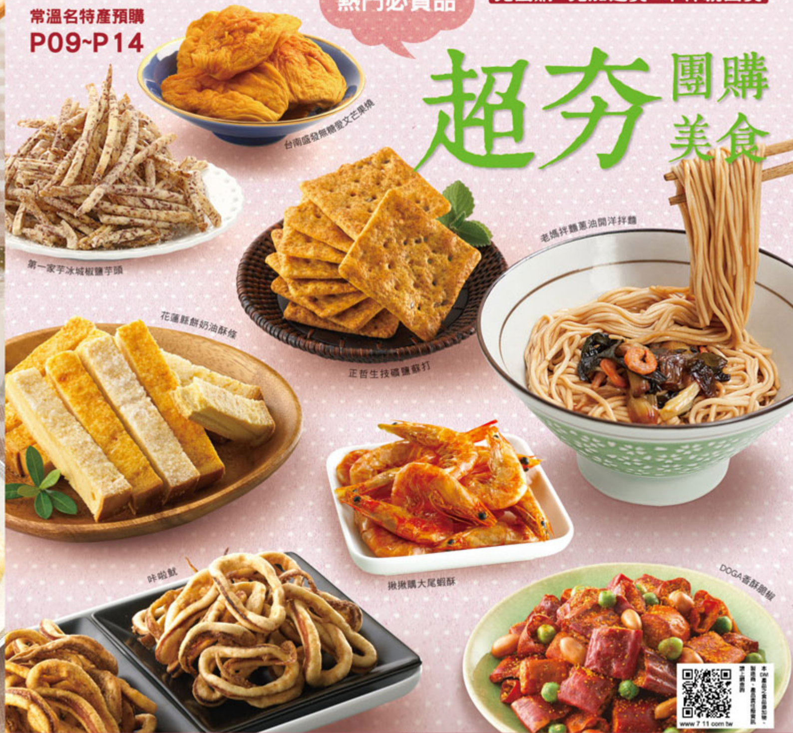
第一家芋冰城椒鹽芋頭