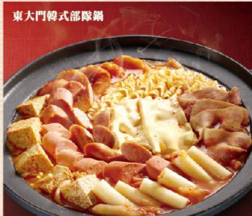
東大門韓式部隊鍋