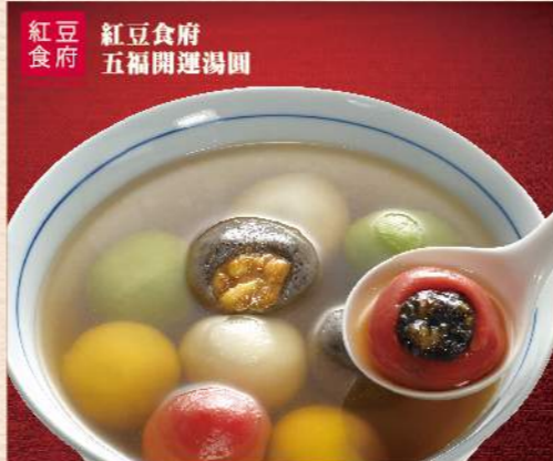
紅豆食府 紅豆食府 五福開運湯圓