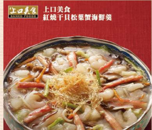
上口美食 紅燒干貝松葉蟹海鮮羹