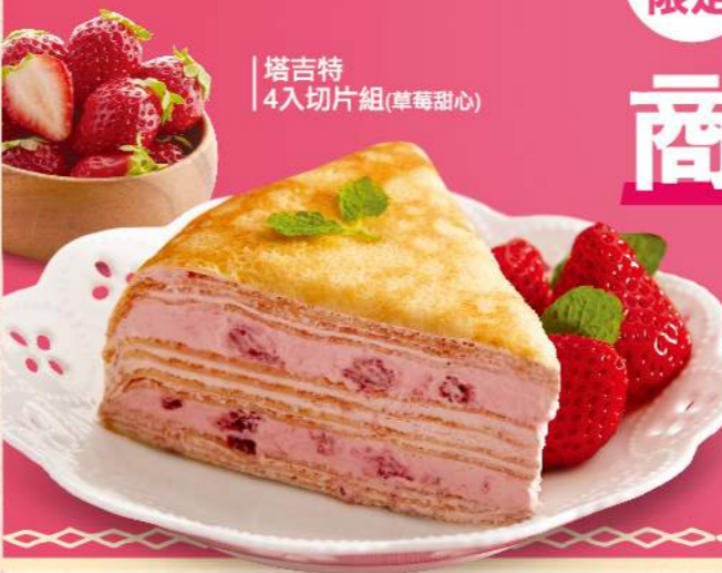
塔吉特 4入切片組(草莓甜心)