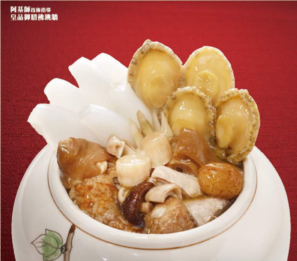
阿基師技師指導 皇品御膳佛跳牆