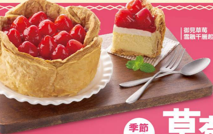
御見草莓 雪融千層起士燒