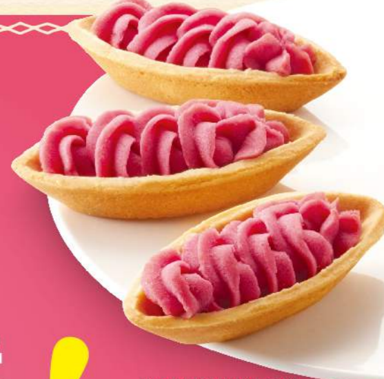
日本福岡草莓牛奶塔