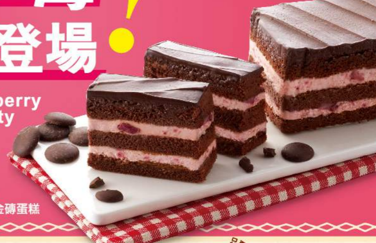
艾波索 草莓黑金磚蛋糕