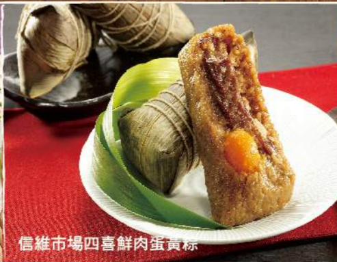
信維市場四喜鮮肉蛋黃粽