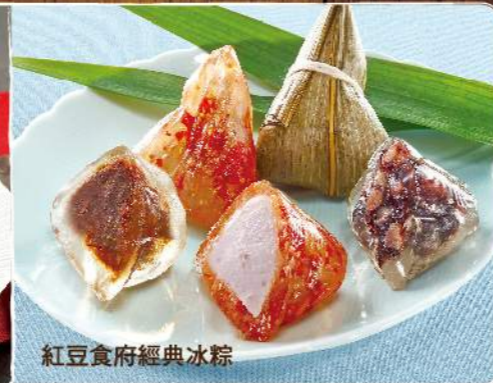
紅豆食府經典冰粽