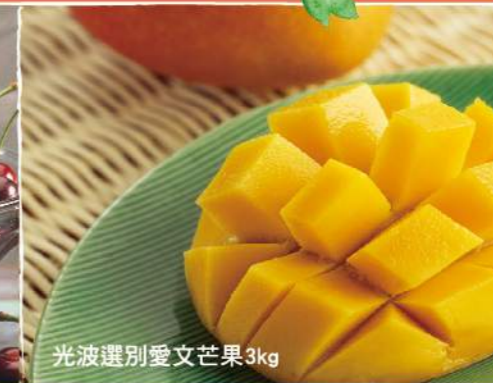
光波選別愛文芒果3kg