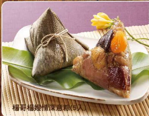
楊哥楊嫂情深意粽(5入)