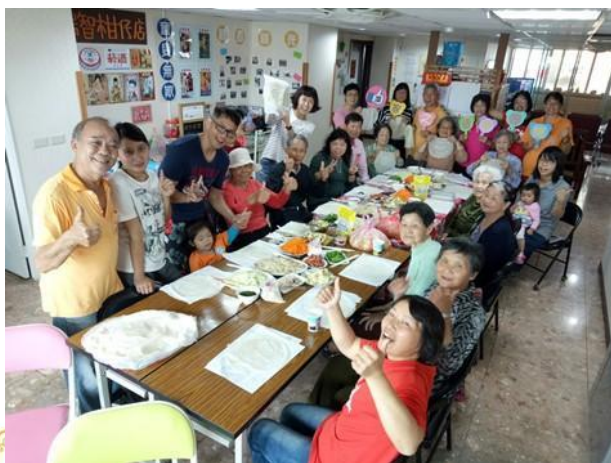
彰化憶智樂活之家