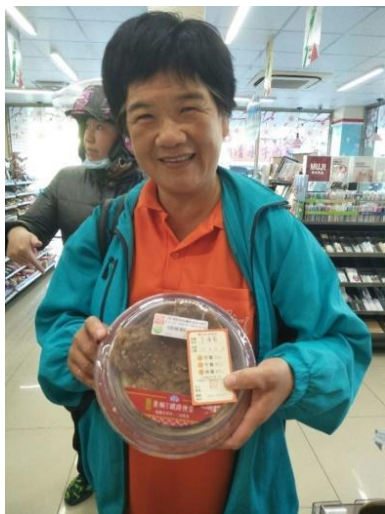
志工協助長者進行取餐