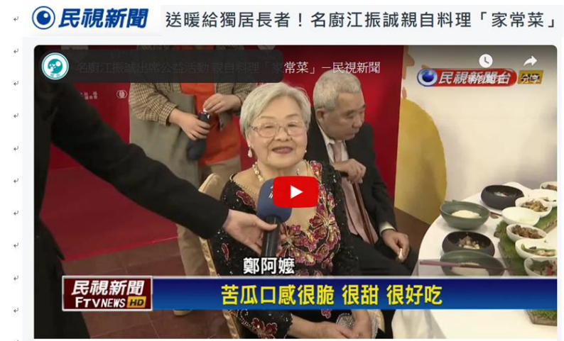
國際名廚江振誠的餐廳一位難求，但今天有一群80歲的老人家，不用排隊就能享用！這是超商和弘道基金會合作，讓獨居老人可以享受到暖心料理，而名廚江振誠特地採用花東食材像是兩來菇、馬告等，做出四菜一湯，讓長輩們嘗鮮。