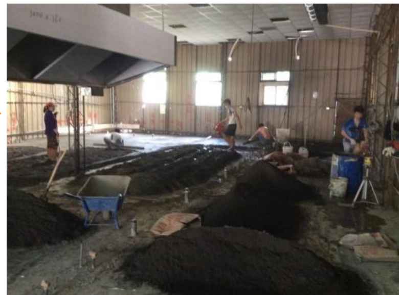
管線埋設及各項施工