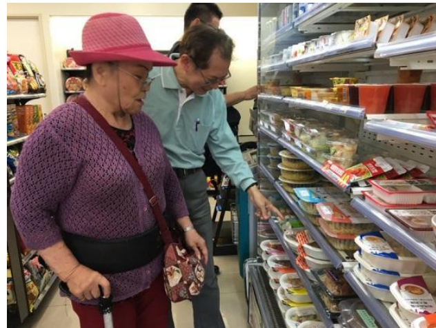
長輩至門市自行挑選餐食