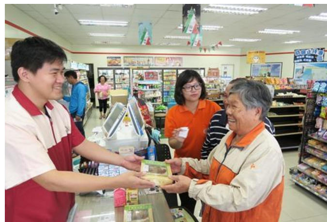
感謝門市一同服務長輩