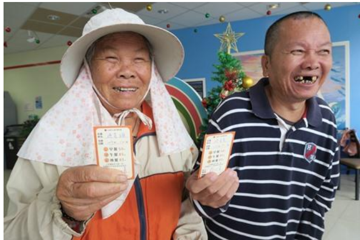
每月評估需求提供長輩餐券