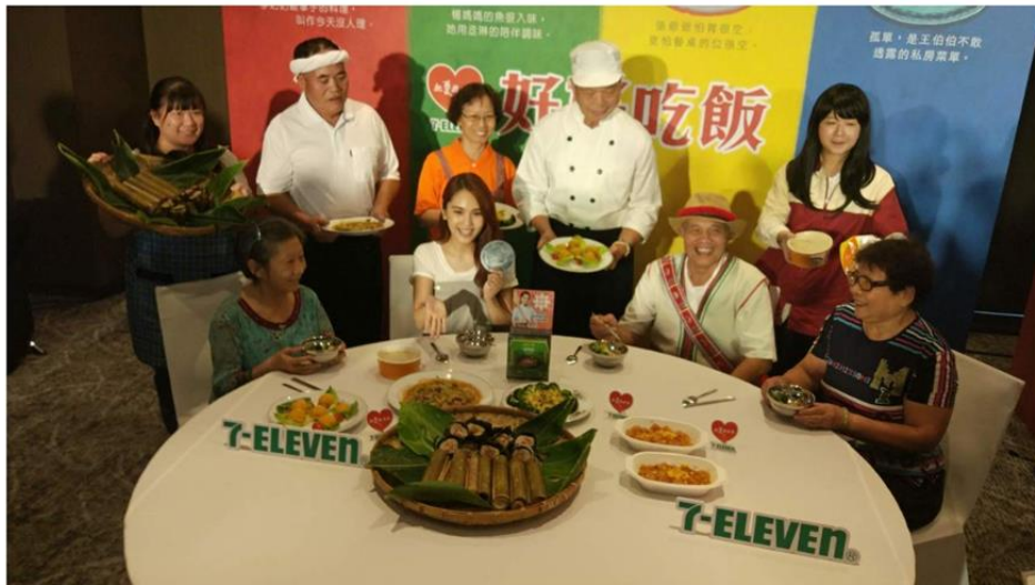
統一超商今年與一粒麥子社福基金會與弘道老人福利基金會合作募集「弱勢獨居長輩共餐計畫」期待提供更多長輩共食的機會。