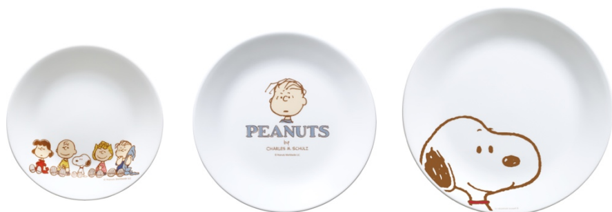
餐盤 3 件組

康寧餐具 × SNOOPY 限定聯名款，可愛兼實用 世界唯一獨家技術，獨特三層夾層玻璃結構製成 質薄輕巧，比傳統強化陶瓷或玻璃餐具更輕、更薄、更耐用 零毛孔特殊結構，防止細菌侵蝕使您安心享用美食 適用於冰箱、洗碗機、微波爐、烤箱、電鍋