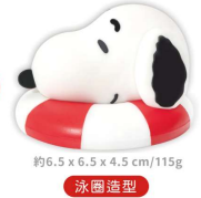
約6.5 x 6.5 x 4.5 cm / 115g 泳圈造型