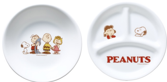
8 吋餐盤 2 件組