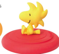
約6.4 x 6.4 x 4.75 cm / 72g 胡士托造型