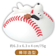
約6.3 x 6.3 x 4 cm / 75g 棒球造型