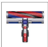
軟質碳纖維 滾筒吸頭