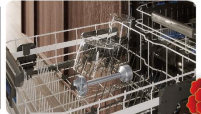
果汁壺與配件皆可放入洗碗機清洗