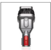
二合一 組合式吸頭