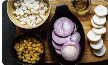
調理配件輕鬆將食材切碎/切片