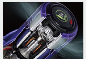
五層過濾系統 捕捉灰塵及過敏原