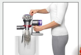
一鍵清理集塵筒 衛生不沾手