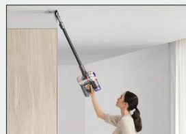
輕盈平衡從地板 至天花板均可清潔