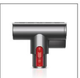
迷你電動 渦輪吸頭