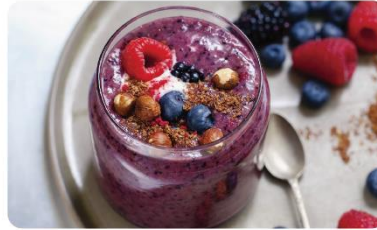
馬達強大，各種食材皆能攪拌均勻