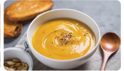
利刀片打出滑順質地