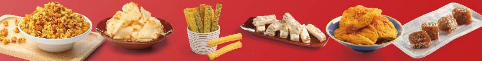
金門聖祖食品 招牌豬腳貢糖