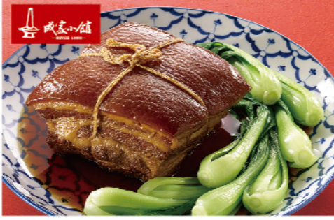
成家小館私藏東坡肉

2014年蘋果日報年菜評比肉類第二名 規格：700g(圓形物480g) 熱量：每100g/301大卡 保存方法：-18°C以下冷凍保存1年 生產工廠：成家小館 ※本圖所列之蔬菜不在實際出貨商品內容中