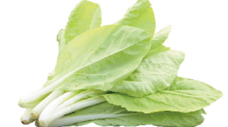
鮮採小白菜(產銷履歷)