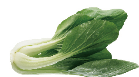
鮮採青江菜(產銷履歷)