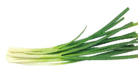
免洗青蔥(產銷履歷)