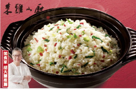
東雅小廚 上海菜飯

有機椰子油製作的菜飯，讓餐餐添新意 規格：600g 熱量：每100g/200.8大卡 保存方法：-18°C以下冷凍保存1年 生產工廠：如記食品有限公司