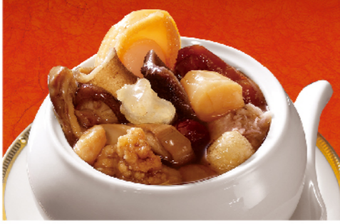
阿秋師鮑參干貝佛跳牆

經典功夫菜，貼心小包裝 規格：450g(圓形物150g)，無附雙 熱量：每100g/59大卡 保存方法：-18°C以下冷凍保存一年