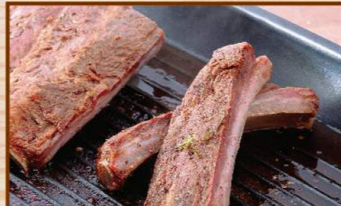
台北濱江美式精肋排