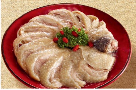
風味館富貴醉雞腿

上選台灣土雞腿肉，酒香濃郁入味 規格：470g(圓形物320g)，整隻土雞腿去骨，未分切 熱量：每100g/106大卡 保存方法：-18°C以下冷凍保存1年 生產工廠：豐城食品有限公司 ※本圖所列之蔬菜僅供擺盤參考