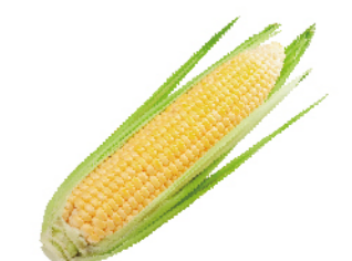
金黃玉米(產銷履歷)