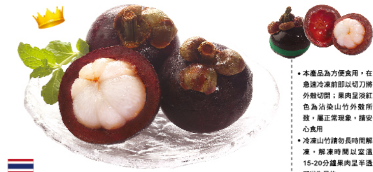
泰國冷凍山竹(帶殼)

水果之後山竹再現，急速冷凍，保留鮮味 規格：每包500g×3包 保存方法：-18°C以下冷凍保存18個月