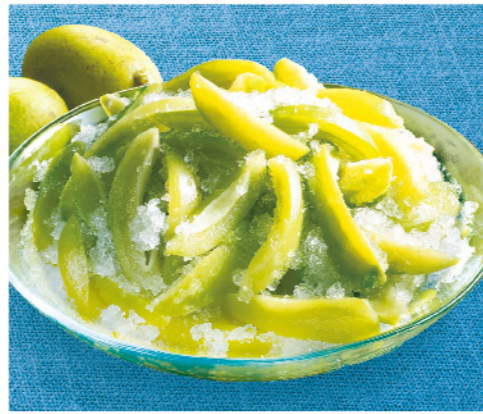
屏東三地門芒果青

無人工色素添加 規格：每包350g(圓形物150g)，共2包 熱量：每100g/110.6大卡 保存方法：-18°C以下冷凍保存18個月 生產工廠：豐城食品有限公司