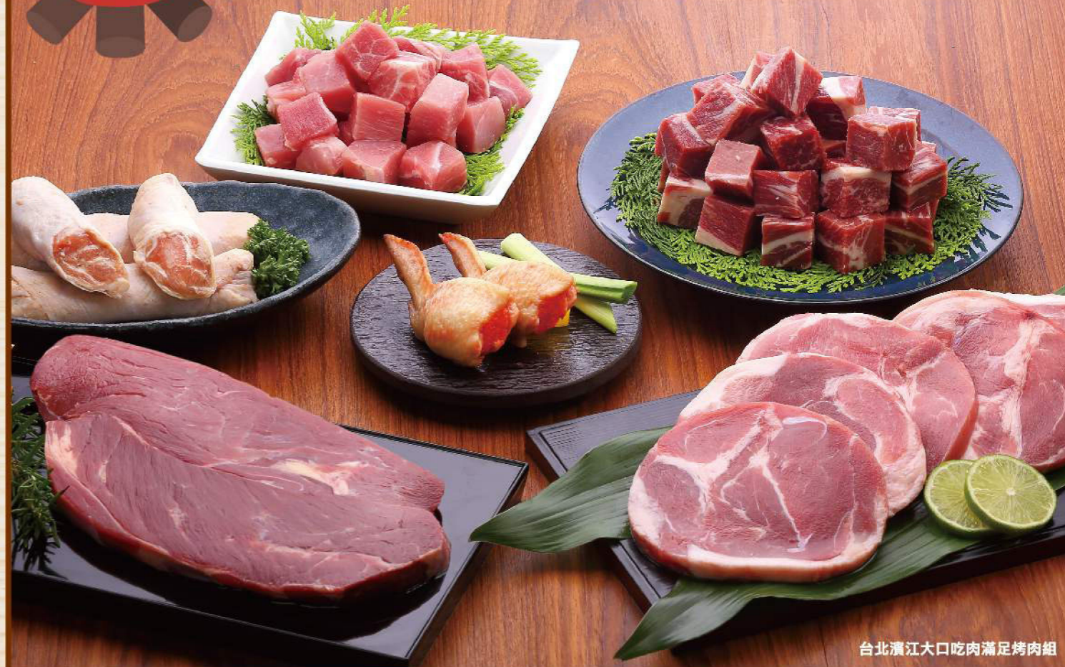
台北濱江大口吃肉滿足烤肉組