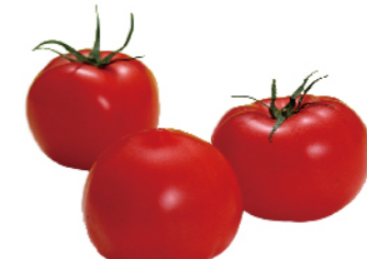
鮮採牛番茄(產銷履歷)