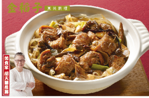
金稻子東北菜 小雞燉蘑菇

東北四敵之一，沒去過東北，也能嚐東北佳餚 規格：1000g(圓形物487g) 熱量：每100g/110大卡 保存方法：-18°C以下冷凍保存1年 生產工廠：東蒙冷凍食品股份有限公司