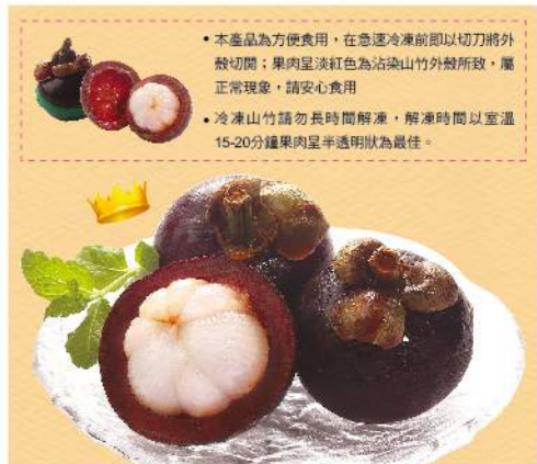
泰國冷凍山竹 (帶殼)

水果之后山竹再現 急速冷凍, 保留鮮味 規格: 每包500克×3包 訂購日5日起, 宅配到府, 贈品不配送 保存方法: -18°C以下冷凍保存18個月