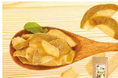
果園風味芭樂鮮果乾

濃郁的芭樂清香Q軟美味 規格: 70克 熱量: 每100克/337大卡 保存方法: 常溫保存12個月