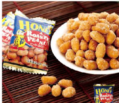
宅間蜂蜜花生量販包

特選花生淋上蜂蜜, 香脆香濃 量販包裝, 隨身攜帶 規格: 共180克, 24包/組 熱量: 100克/602大卡 保存方法: 常溫保存8個月