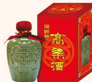
金門風獅爺53度高粱酒

辟邪鎮煞, 搭餐首選 規格: 600ml 酒精濃度: 53% 保存方法: 無限期 製造商: 金門大順酒業