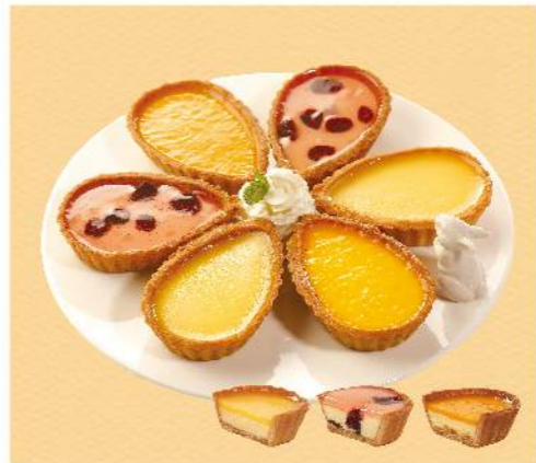
依蕾特 法式風味乳酪塔

酥香塔皮佐法利利級乳酪, CP值爆表 規格: 蘇打塔×2、檸檬×2、芒果×2, 6入/盒 熱量: 蘇打塔 每100克/390大卡, 檸檬 每100克/393大卡 芒果 每100克/385大卡 訂購日5日起, 宅配到府 贈品不配送