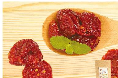
果園風味蕃茄鮮果乾

微酸帶甜的美妙滋味 規格: 65克 熱量: 每100克/352大卡 保存方法: 常溫保存12個月