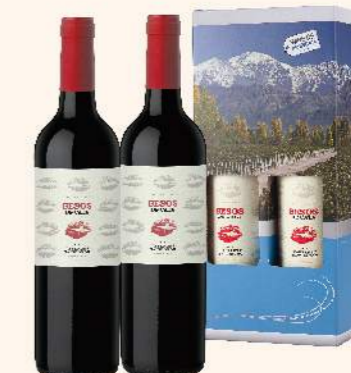
阿根廷 醇印卡本內蘇維翁 雙入禮盒

熱情的阿根廷酒, 平易近人且帶著 熱鬧喧騰的氛圍, 搭配精緻的禮盒 是伴手禮最佳首選