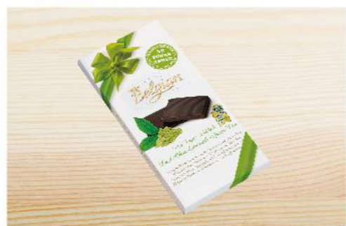
白麗人無糖抹茶巧克力

全新口味, 抹茶控的您絕不能錯過 規格: 100克 熱量: 每100克 / 471大卡 保存方法: 常溫保存14個月