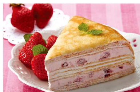
塔吉特草莓甜心千層切片

創單月六千盒實績 網路千層熱銷品牌 規格: 4片/盒, 共240克 熱量: 每100克 / 211.7大卡 保存方法: -18°C以下冷凍保存3個月