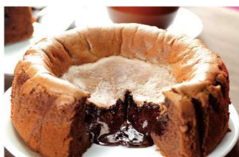
御見巧克力凹蛋糕三入

康熙、食尚玩家報導, 採用高純度 比利時74%調溫巧克力 規格: 390克/入, 3入/組 熱量: 每100克/313大卡 訂購日5日起, 宅配到府 贈品不配送