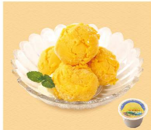
枋山觀光果園芒果冰淇淋

不加一滴水愛文鮮果製作 規格: 90ml/入, 6入/盒 熱量: 每100克/68大卡 保存方法: -18°C以下冷凍保存6個月