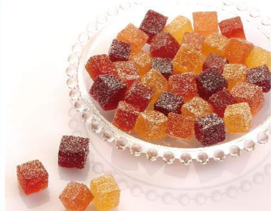
法式水果軟糖 (綜合)

天然果汁製成, 法式工法, 純素食Q軟好吃 規格: 150克 熱量: 每100克/352大卡 保存方法: 常溫保存10個月