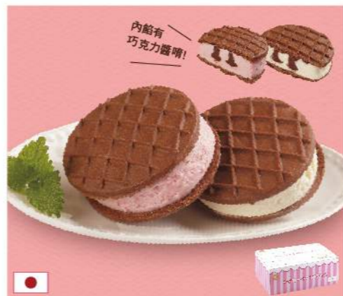
日本森永巧克力餅乾夾心冰淇淋禮盒

日本人氣明星商品, 草莓香草雙口味 規格: 33克 (38ml) × 18個 熱量: 香草 每100克/287大卡 / 草莓 每100克/280大卡 保存方法: -18°C以下冷凍保存24個月