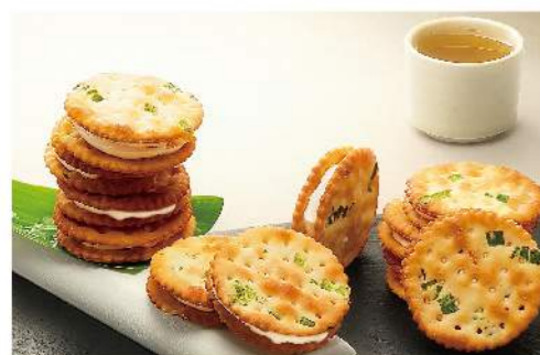
中祥巧心蘇打 蔥香原味

熱銷免團購, 單包即出貨 規格: 147克 熱量: 每100克/446大卡 保存方法: 常溫保存3個月