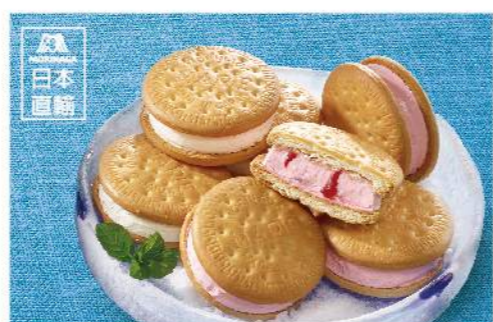
日本森永瑪莉餅乾 夾心冰淇淋禮盒 香草&草莓

2014年搶購款, 草莓口味季節限定 規格: 30克×18入, 香草×9入、草莓×9入 熱量: 每100克/290大卡 保存方法: -18°C以下冷凍保存24個月