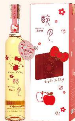
醉月 HELLO KITTY蘋果酒

紅潤蘋果幸福滿滿 香氣迷人口味香甜 規格: 容量380ml 酒精濃度: 7.5% 保存期限: 無限期 保存方法: 常溫