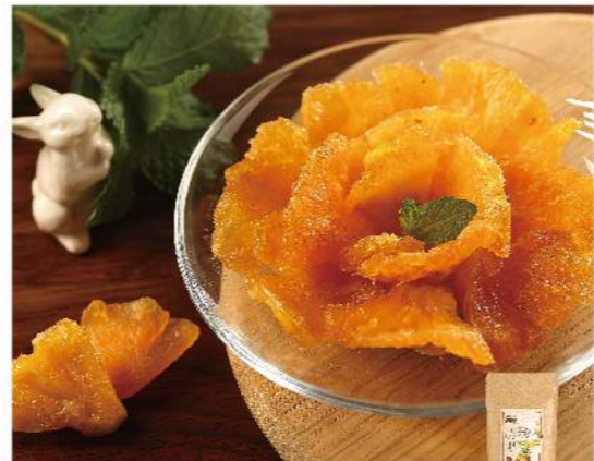
果園風味鳳梨鮮果乾

滿滿的太陽能量, 格外香又甜 規格: 70克 熱量: 每100克/376大卡 保存方法: 常溫保存12個月