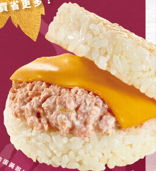
老協珍湯米 鮭魚起司米堡