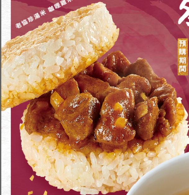
老協珍湯米 咖哩雞米堡