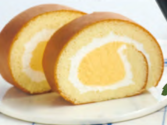
亞尼克 芒果生乳卷