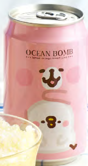
卡娜赫拉的小動物 檸檬柳橙果汁飲