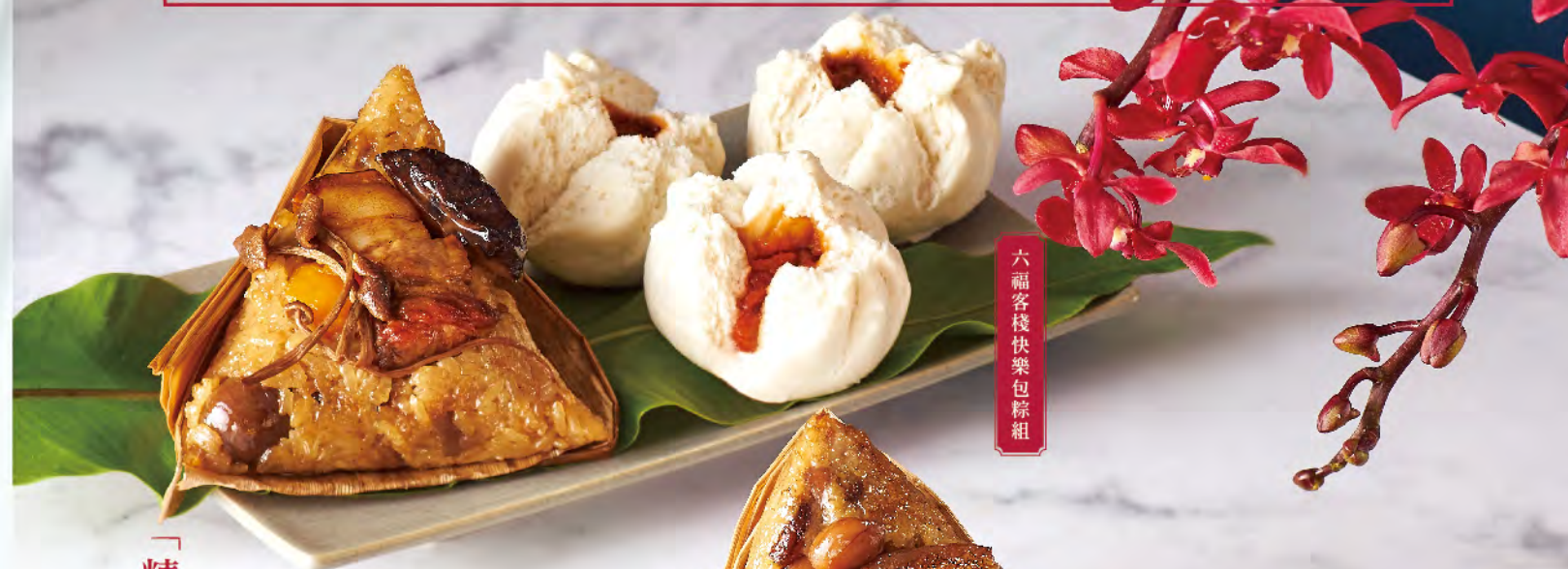
六福客棧快樂包粽組