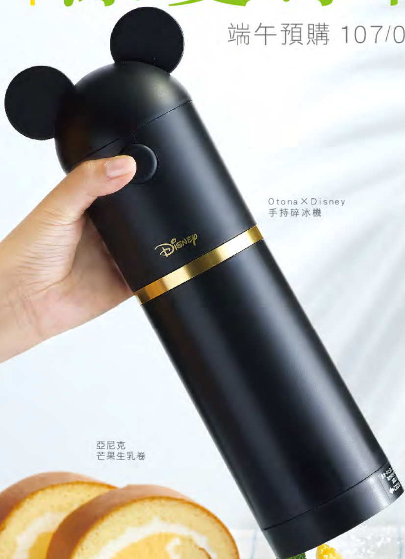
Otona X Disney 手持碎冰機