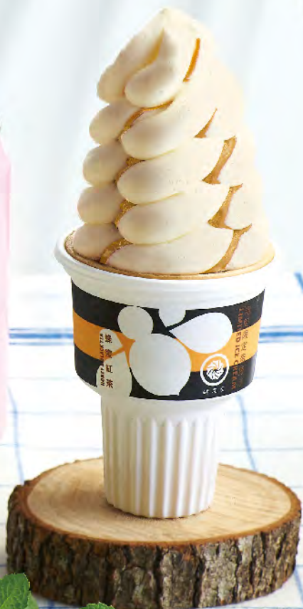
蟻尾家 華人冰王蛋捲冰 蜂蜜紅茶