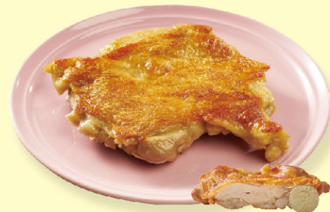
21風味館黃金香酥雞腿排