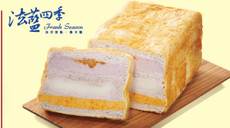
法藍四季芋泥流沙三明治