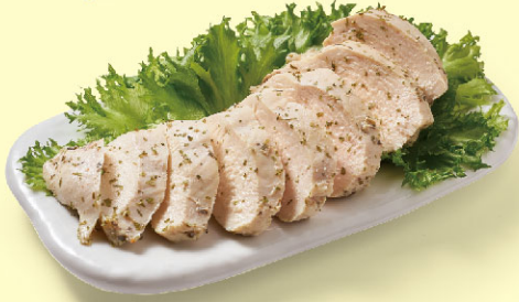
21風味館鮮嫩雞胸肉 義式香草口味