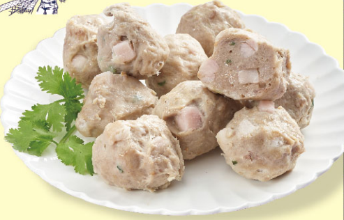
海味本丸芋香貢丸