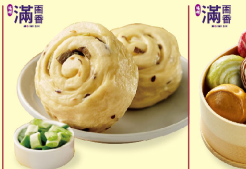
滿面香蛋香蔥卷饅頭