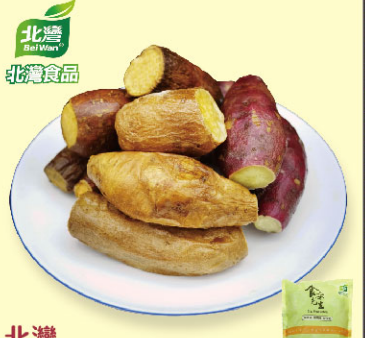
北灣冰烤完熟三色地瓜

規格：共700公克 (內含金鑽地瓜、金山紅肉地瓜、栗子地瓜) 保存方法：-18℃以下冷凍保存18個月