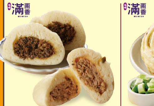
滿面香綜合肉包組

規格：8入/包(梅乾菜肉包×4+瓜仔肉包×4) 共800公克 保存方法：-18℃以下冷凍保存一年