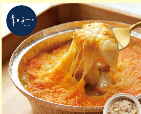
素日子特濃起司焗烤白菜