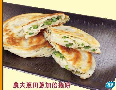
農夫蔥田蔥加倍捲餅