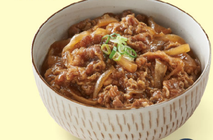
六福美饌日式牛丼