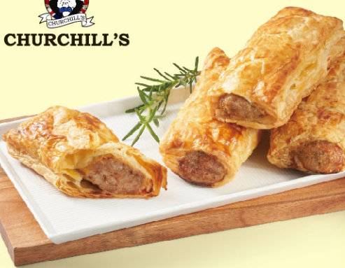
邱吉爾傳統肉捲餅