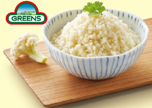
冷凍米粒狀花椰菜

1袋 預購價 288元 12袋 預購價 2,988元 本店取貨 26504995 本店取貨 26508214