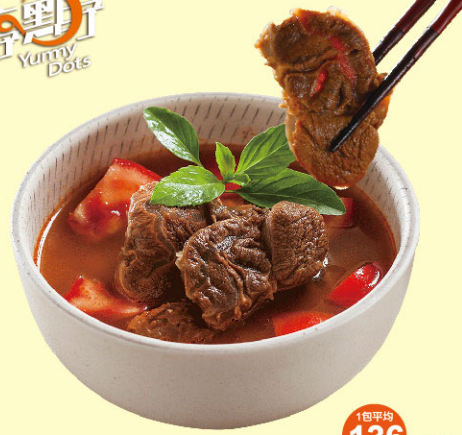
享點子蕃茄牛肉湯