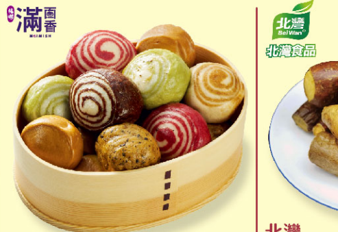
滿面香一口小饅頭