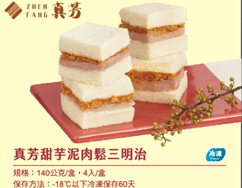
真芳甜芋泥肉鬆三明治