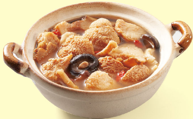
宮廷素食-麻油猴頭菇

規格：291g/包(固形量190g)，共2包 保存方法：-18℃以下冷凍保存18個月