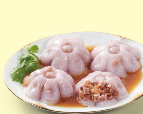
蒸健康香芋梅花肉圓