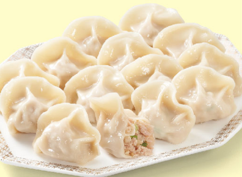
鼎尚鮮高麗菜豬肉水餃

1包 預購價 329元 10包 預購價 1,110元 宅配到府 ibon條碼搜尋碼 26510422 宅配到府 ibon條碼搜尋碼 26510392