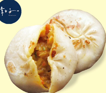
素日子鮮蔬爆汁餡餅