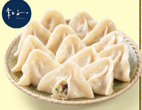
素日子珍饈水餃-高麗菜口味