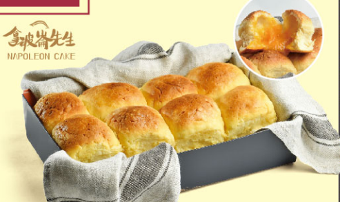
拿破崙菠蘿流沙麵包

規格：350公克/盒(8入裝) 保存方法：冷藏5天(含宅配日)，到貨日(含)尚有4天效期