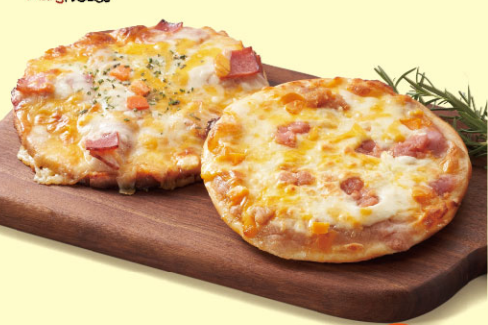
瑪莉屋比薩-薯泥培根