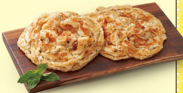
龍鄉味紅骨九層塔抓餅