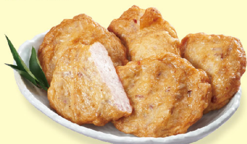
阿中丸子芋頭天婦羅