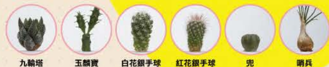
九輪塔 玉麒麟 白花銀手球 紅花銀手球 兜 哨兵