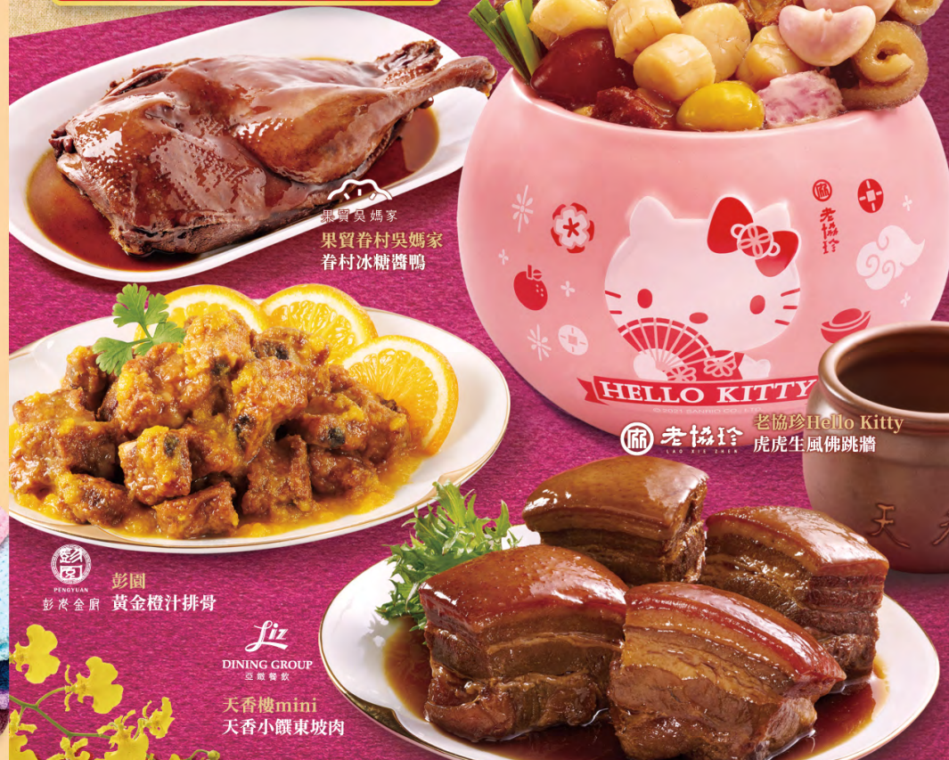
貴買吳媽家 買買春村吳媽家 春村冰糖醬鴨

指定品項 任選 2 件 95 折 部分指定品項4件92折 價低者折並以五捨六入計算，團圓、家電、用品及部分商品除外