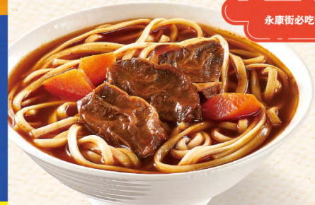
永康街必吃牛肉麵