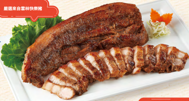
廠選來自雲林快樂豬